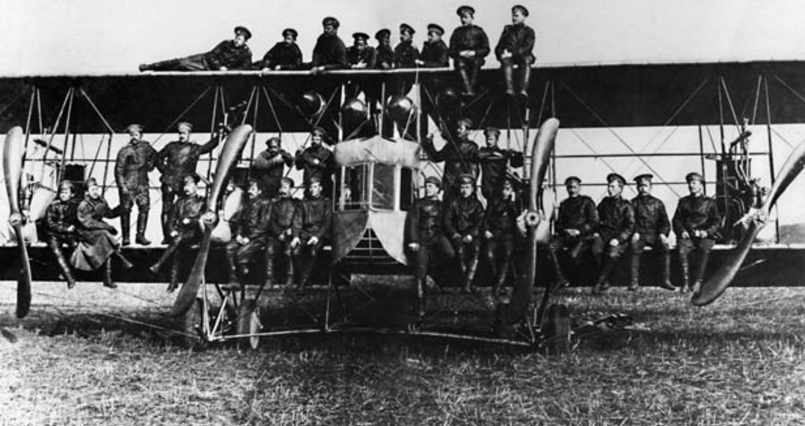
1915 р. Екіпаж літака «Ілля Муромець» на аеродромі м. Яблонна поблизу Варшави