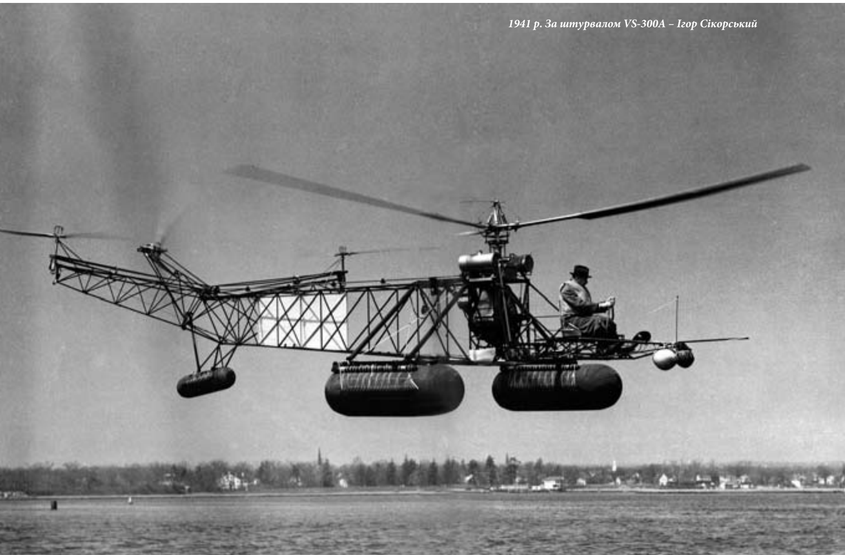
1941 р. За штурвалом VS-300A – Ігор Сікорський

Ігор Іванович був глибоко віруючим православним християнином. Його духовна спадщина була викладена в роботі «Небо і Небеса». Власне переклад її українською і складає другу частину книги «Ігор Сікорський. Від Києва до Коннектикута, від неба до Небес». Варто зауважити, що «Небо і Небеса» – це роздуми Сікорського-християнина над питанням сенсу і цінностей існування сучасної людини й суспільства загалом. Цей твір складається з кількох окремих частин: «Послання молитви Господньої», «Невидима боротьба», «Еволюція душі» та «У пошуках Вищих Реальностей». Ці роздуми, які були написані не Сікорським-богословом, а Сікорським-релігійним мислителем, зберігають актуальність і сьогодні. Так, головний висновок його аналізу міститься у тезі: «... Всі наші досягнення видаються чимось незначним порівняно з вічними цінностями людини – Божого