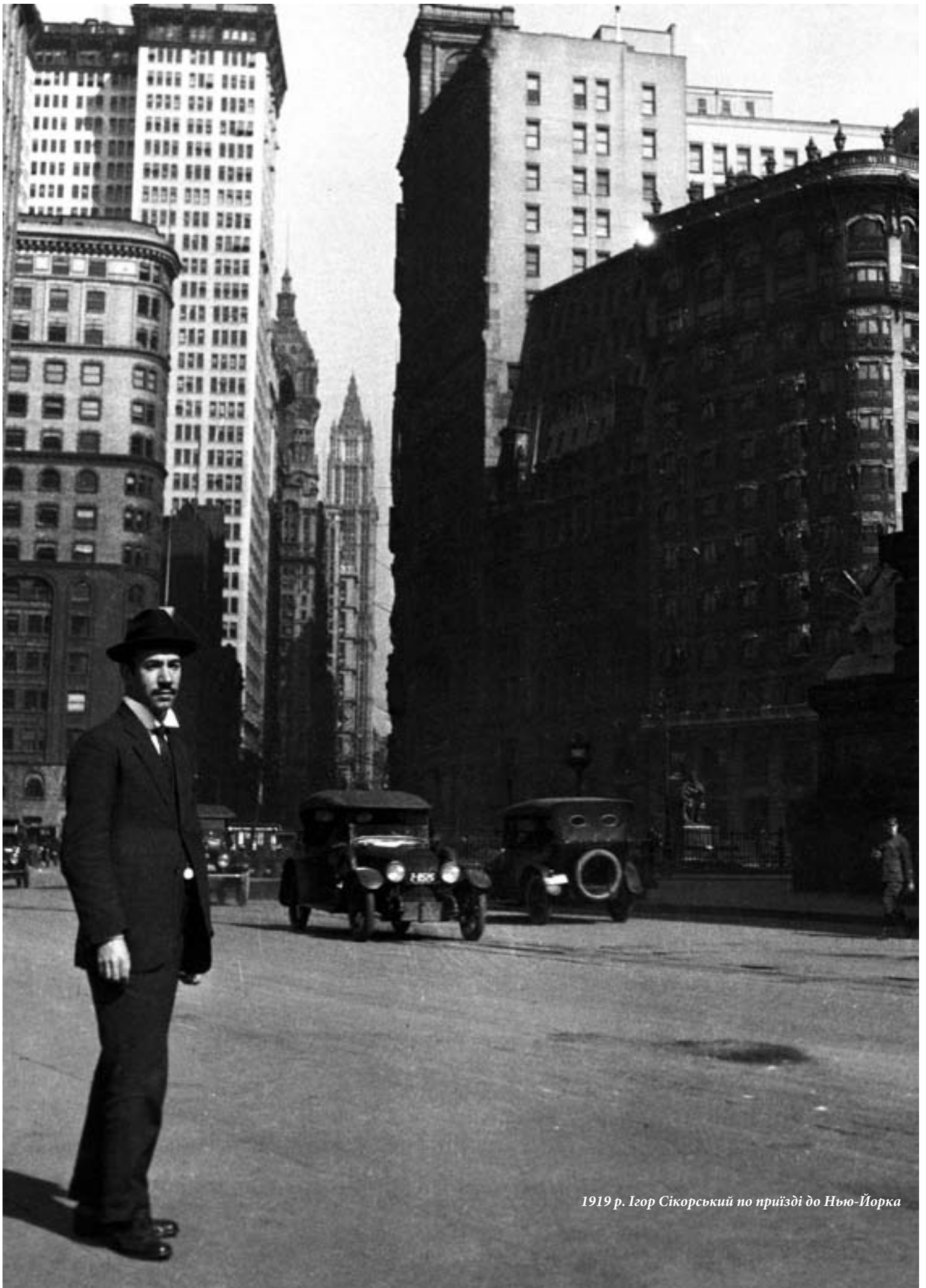
1919 р. Ігор Сікорський по приїзді до Нью-Йорка